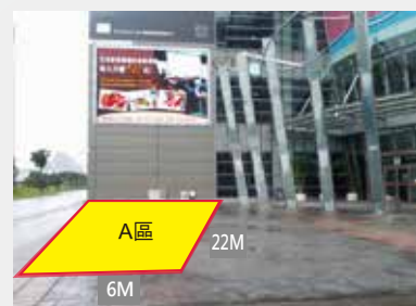
備註: 提供給廠商展示使用