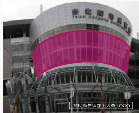
贊助廣告須加上大會 LOGO

尺寸: 4,325公分 X 4,000公分 X 950公分高 · 共計400m (上層寬) (下層寬)