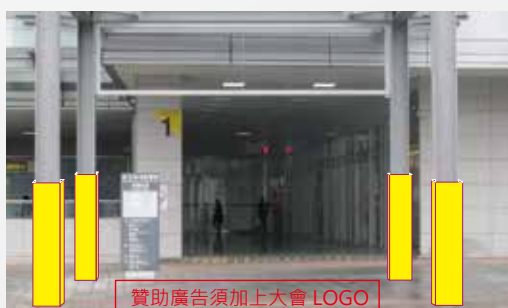
贊助廣告須加上大會 LOGO