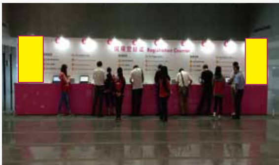
贊助廣告須加上大會 LOGO