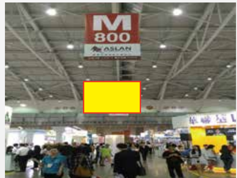
贊助廣告須加上大會 LOGO