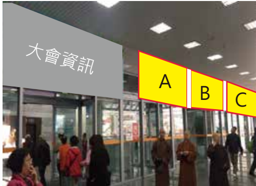
贊助廣告須加上大會 LOGO