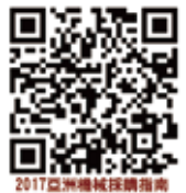
2017亞洲機械採購指南