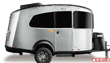
Airstream Basecamp露營車 179萬元起4車位車庫 歡迎預約試乘