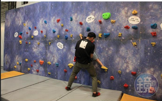
戶外用品展現場架設小型攀岩場，民眾可現場體驗。

隨著戶外活動盛行，戶外用品展也漸受重視，2019年戶外用品展自今天（9月27日）起一連4天展出，雖然露營等設備仍受重視，但戶外安全觀念興起，主辦單位邀請達人舉辦的講座高達32場，才是最吸引人之處。