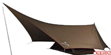
Snow peak多功能帳篷 1萬3090元 登山休閒用品