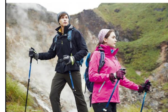
歐都納GORE-TEX防水外套、多功能防水背包，是戶外玩咖們的高需求，圖／歐都納提供