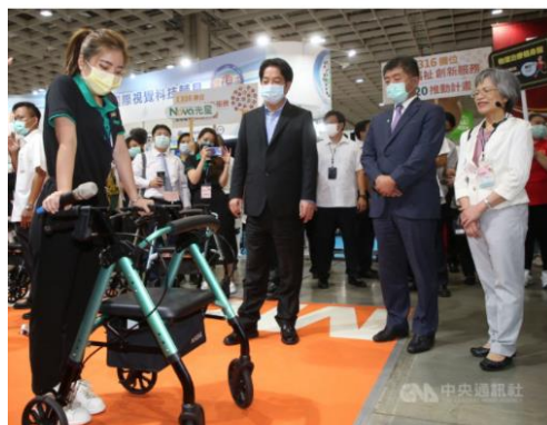
台灣輔具暨長期照護展30日在南港展覽館登場，副總統賴清德（前右3）與衛福部長陳時中（前右2）參觀展場，中央社記者鄭文通／109年7月30日

（中央社記者蔡芳敏台北30日電）副總統賴清德今天表示，輔具產業在台灣發展有3大利基，台灣邁入高齡社會，需求增加，台灣是ICT產業大國，有能力將高科技融入這項產業，政府政策更是大力支持。