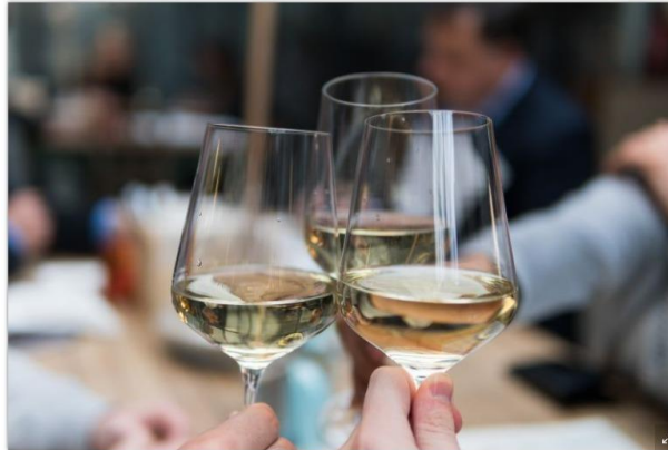
▲2023台北國際酒展·純酒展，於4月14日至17日假台北世貿一館展出。（示意圖/取自unsplash）